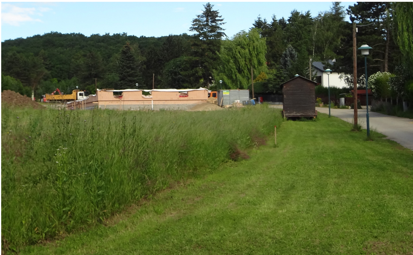
Neue Bauplätze in Pyhra