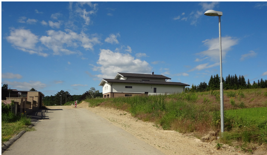
Ansicht Pyhra Verbindungsstrasse Siedlung

Auch in der KG Gnadendorf werden ebenfalls die noch fehlenden Straßenbeleuchtungskörper im „Hinterausbereich“ im Herbst zur Aufstellung gelangen.