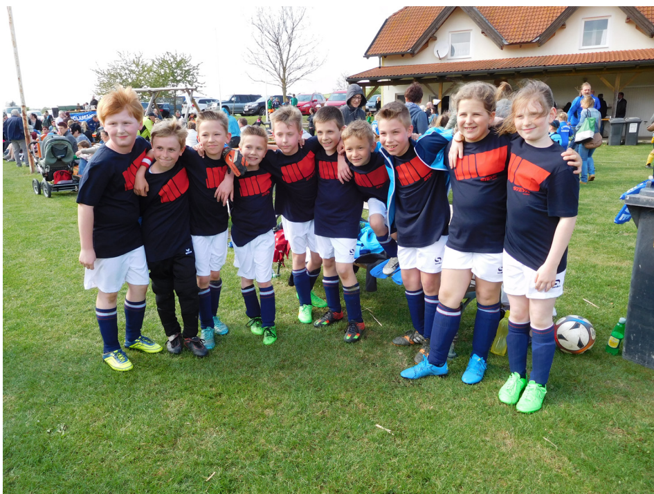
Den 5. Platz von 16 Schulen erreichten die Volksschüler aus Gnadendorf beim Mike Cup am Sportplatz in Gnadendorf. Zahlreiche Besucher machten das Turnier zum Erlebnis.